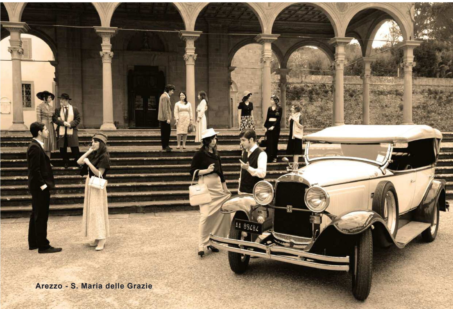
Arezzo - S. Maria delle Grazie

Istituto nazionale di previdenza per i dipendenti dell'amministrazione pubblica