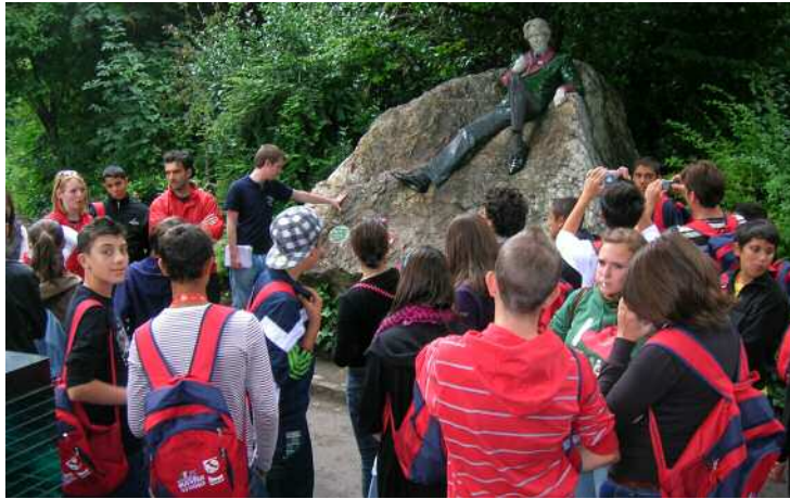
Dublino - Oscar Wilde park

La settimana in Italia l'ho trascorsa in montagna, in una struttura alberghiera a 1500 metri, con bambini dai 7 agli 11 anni. All'estero sono stata "randomizzata" in Irlanda con ragazzi di 14 e 16 anni. Il supporto fornito dalla Direzione del Welfare e' stato